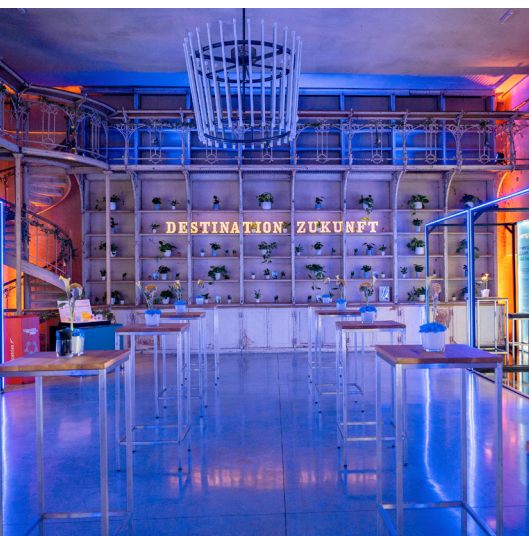
Destination Zukunft

Zu unseren zufriedenen Nutzer zählen: A1, A-Null Software, Architekturtage, Armutskonferenz, Austrian Airlines/ Lufthansa, Bank Austria, Breitling, Erste Bank, Global Social Business Summit, Hennes & Mauritz, Immo FutureLab, Land Rover, Lena Hoschek, Levi's, Kapsch, Moncler, Netflix, ÖSV, Petar Petrov, Raiffeisen, Skiny, STRABAG, Urban Innovation Vienna, Vienna Design Week, Vienna Fashion Awards, Wienerberger, Wien Tourismus, Wirtschaftsagentur Wien.