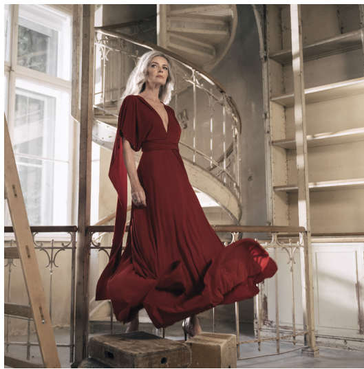
Paulina Porizkova for Vienna Fashion Awards