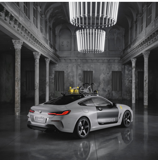
Vagabund Moto